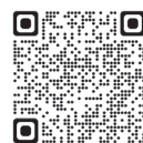
「年収の壁」に係る取扱い